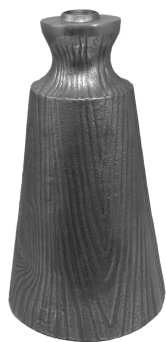
Part/ Μέρος - 1